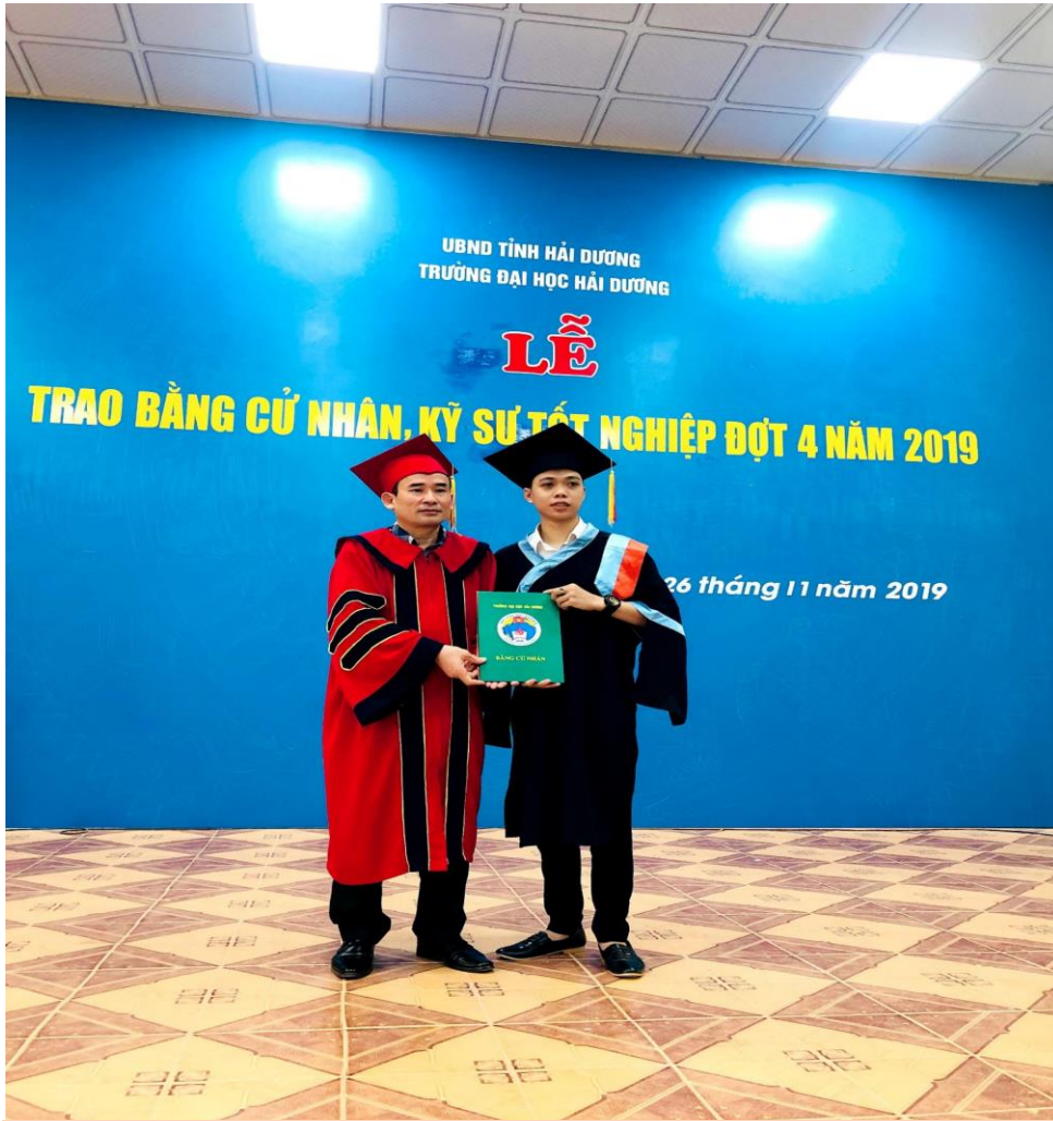
Sinh viên ngành Chính trị học nhận Bằng tốt nghiệp