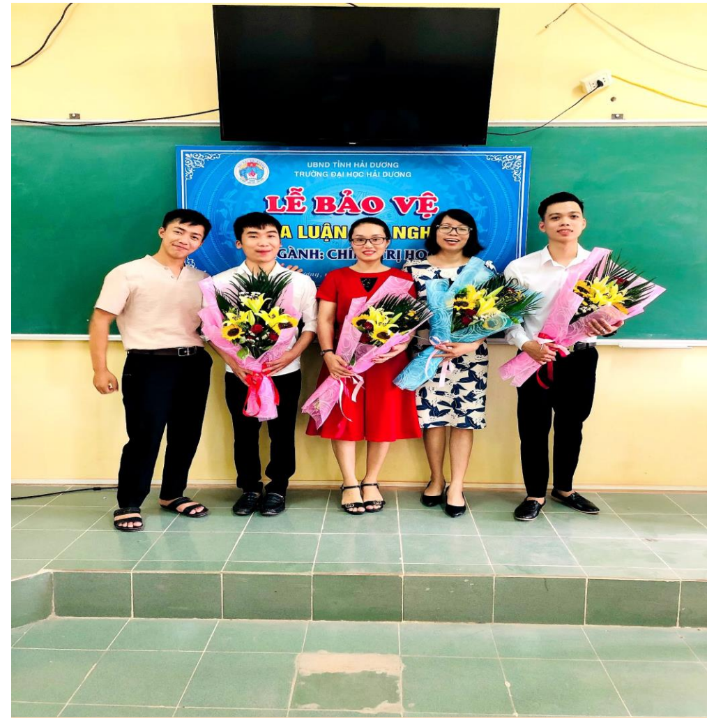
Lễ bảo vệ khóa luận tốt nghiệp của sinh viên ngành Chính trị học